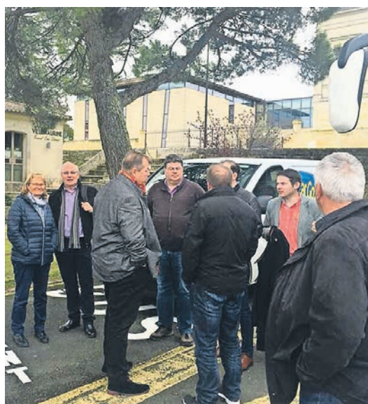
Die Fraktionschefs und ihre Partnerinnen und Partner reisten nach Bordeaux.