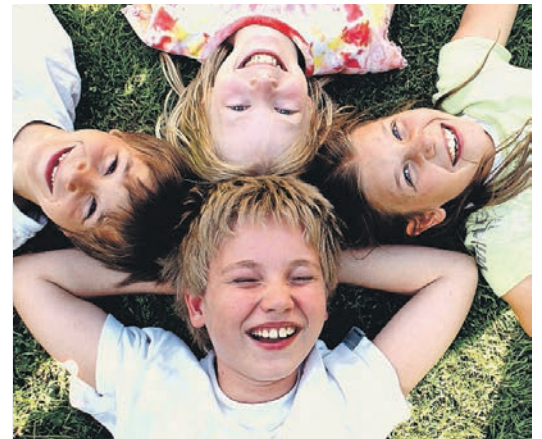
Freie Plätze für Kinder an Privatschulen sind Mangelware.

Als letzte Option verbleibt demnach noch Bratsch selbst. Dort liebäugelt man laut Gsponer mit der Übernahme von dezentralen Liegenschaften, die zu Schulräumen ausgebaut würden. Geplant ist Platz für rund 20 bis 30 zusätzliche Schüler. Die entsprechenden Verhandlungen ziehen sich aber in die Länge. Deshalb behält Gsponer gleichzeitig den Standort Eggerberg nach wie vor im Auge, weil er diesen «sehr interessant» findet. Da die dortige Entwicklung wie erwähnt zurzeit offen ist und für die Eröffnung eines zweiten Standorts, wie beispielsweise der pädagogische Aufbau, eine gewisse Vorlaufzeit benötigt wird,