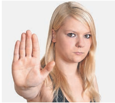
Einsteigerkurs für Jugendliche.

Brig-Glis Junior Protect ist ein äusserst effizientes Sicherheits- und Selbstverteidigungstraining, das für Jugendliche zwischen 13 und 17 Jahren aus dem ursprünglichen KravMaga-System weiterentwickelt wurde. In sechs Lektionen werden sich die Kursteilnehmer vom 17. April bis 29. Mai theoretisch und praktisch mit dem Thema Gewalt auseinandersetzen. Sie lernen dabei speziell auch die Auslöser, Konflikt-