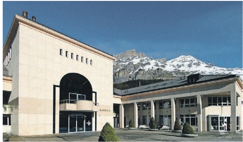
Im Bäderdorf will man wieder mehr Gäste.

Mit der neu geschaffenen Buchungsplattform der MRAG ist es möglich, Angebote für die zusätz-