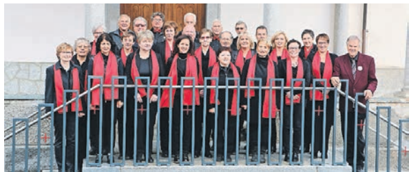
Der Gommer Chor.