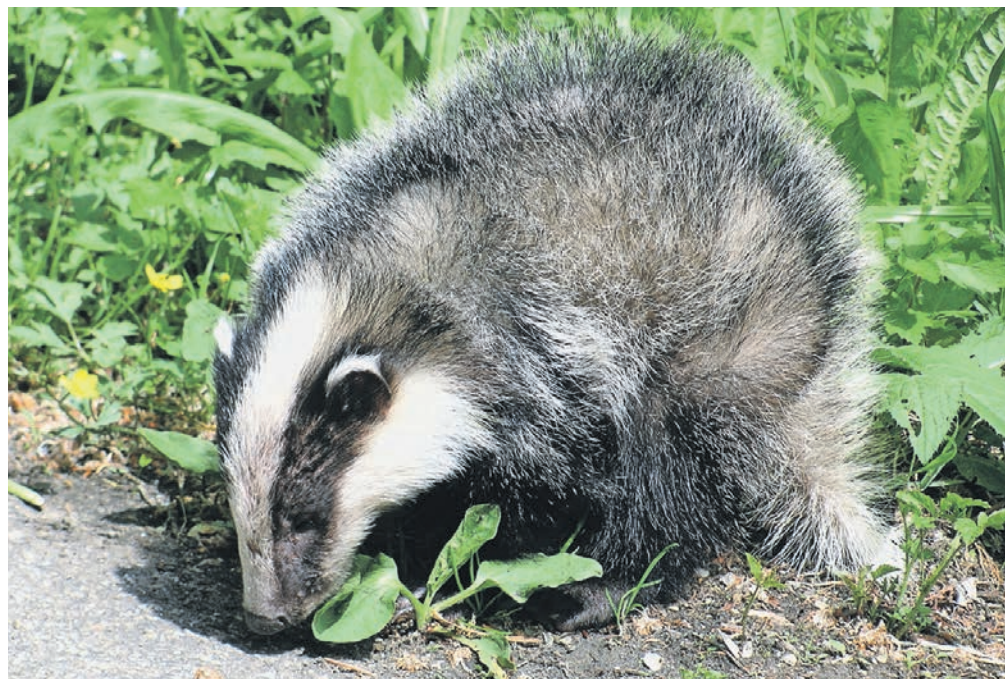
Der Dachs ist auch bei uns heimisch.