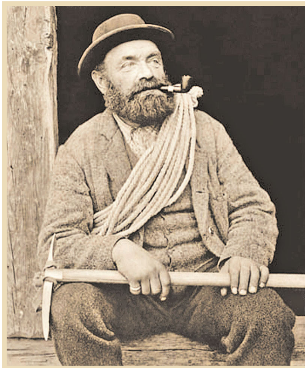
Der Bergführer – ruhig und Vertrauen einflössend. Obwohl die Erstbesteigungen jeweils den Gästen zugeschrieben werden, stehen Walliser Bergführer als Erste auf vielen Gipfeln.

Morgins-les-Bains – das ist nur ein Beispiel. Jede Walliser Station versucht auf ihre Wei-