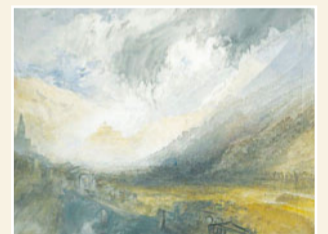
Das Licht von Sitten inspirierte William Turner.

Das Wallis, seine Landschaft und ihre Bewohner entgingen der Aufmerksamkeit des geschulten Auges der Kunstmaler nicht. Davon legen viele Meisterwerke in den Museen und in privaten Sammlungen ersten Ranges ein bemerkenswertes Zeugnis ab.