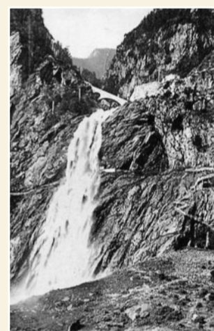
Die «Kuhpisse», ein Wasserfall von 116 Metern.

Die «Pissevache», von den Einheimischen prosaisch «Kuhpisse» genannt, ist ein Wasserfall von 116 Metern der Salenfe, bevor sie das Tal erreicht. Die Reisenden auf dem Weg nach Saint-Maurice oder Martinach zeigen sich immer wieder beeindruckt von den ungestümen Wassermassen. Maler, Dichter und Schriftsteller haben das Naturphänomen besungen. Gerade in der Romantik ist immer wieder vom stiebenden Wasser die Rede, wie zum Beispiel bei den Reisebeschreibungen von Wolfgang von Goethe: «Endlich kamen wir beim Wasserfall an, der seinen Ruf mehr als viele andere verdient. Wir kletterten hinauf und setzten uns und wir wünschten uns, dass wir Stunden und Tage an dieser Stelle verbringen könnten.» Die Reise des Dichters fällt auf das Ende des 18. Jahrhunderts, also in die Zeit der Romantik. Die «Pissevache» entging der Moderne nicht. Im 20. Jahrhundert, nach dem Bau des Barberine-Kraftwerkes, drohte sie auszutrocknen. Der Widerstand von Naturfreunden sorgte für eine Restwassermenge, die nach ergiebigen Regen eindrucksvolle Dimensionen annimmt.