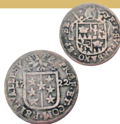
Man sah im täglichen Gebrauch mehr Batzen als Goldtaler.

Ein Maurer verdient 1.20 Franken am Tag, ein Handlanger 0.80 Franken. Nach Allerheiligen sinken die Ansätze auf 1.0 und 0.60 Franken. Ein Steinhauer kommt auf 1.60 Franken und ein Grubenarbeiter auf 1.40. Eine Sandgabel kostet 0.40 Franken, ein Tagewerk für den Transport von Tuffsteinen wird mit 2 Franken abgegolten. Das Pfund Fleisch muss mit 20 Centimes berappt werden, Butter mit 40, Magerkäse mit 25, Vollfettkäse mit 30, weisses Brot mit 15 und Roggenbrot mit 8 Centimes.