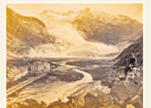
Die Walliser Landschaft inspiriert alle Dichter.