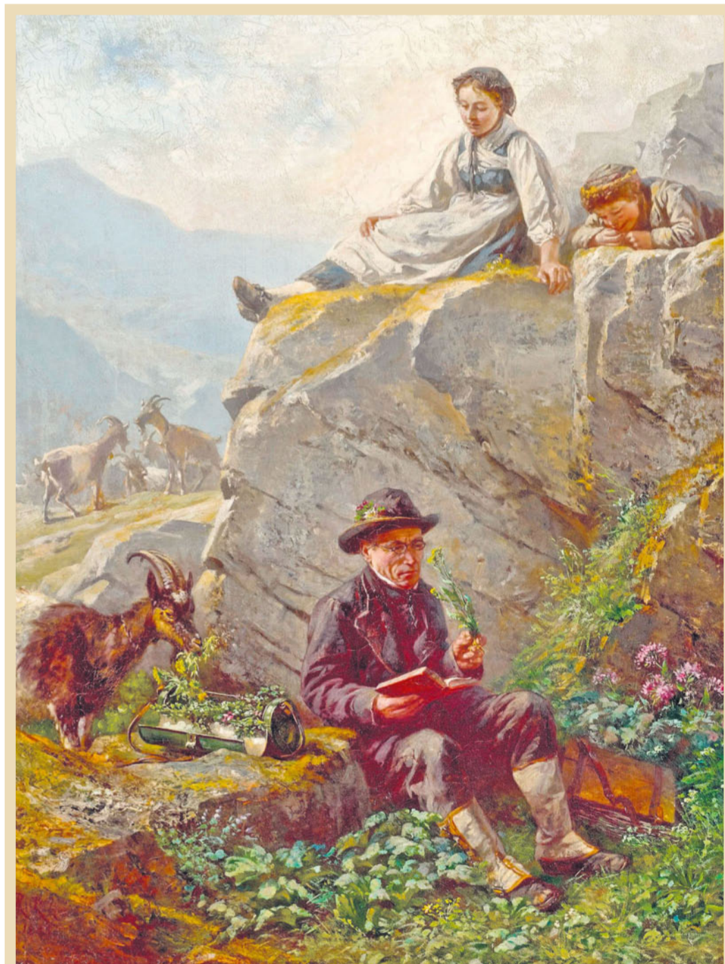
Ein Botaniker im idyllischen Wallis des Malers Raphael Ritz.

Als einer der ersten stellt er seine Staffelei in Savièse auf und verfällt dem Licht dieser Landschaft. Gleichzeitig macht er diese Landschaft auch anderen Künstlern bekannt, darunter Ernest Biéler.