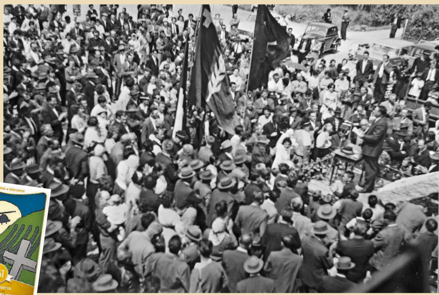
Illegal angepflanzte Reben, die «vignes maudites», werden 1961 mit Unkrautvertilger vernichtet.

Einige Welschwalliser Weinbauern nehmen es mit dem Raumplanungsgesetz nicht so genau. Sie pflanzen auch dort Rebber an, wo dies nicht gestattet ist. Der Staatsrat bemüht sich, annehmbare Lösungen zu finden, um dieser Praxis einen Riegel zu schieben, die durch den Bundesbeschluss vom 6. Juni 1958 verboten wird, und der eigentlich temporäre Massnahmen zugunsten des Weinbaus vorsieht. Doch vergeblich. «Bern» drängt zum Handeln. Am Tag nach dem Herrgottstag, am 2. Juni 1961, bietet der Staatsrat Helikopter auf, welche mit Unkrautvertilger die verbotenen Weinberge vernichten sollen. Die Maschinen werden von den Piloten Hermann Geiger und Fernand Martignoni pilotiert. Sie steigen um 4.00 Uhr in der Frühe auf und bringen das Gift auf die Rebberge von Saxon, Fully, Saillon und Vétroz aus. Zwei Stunden später landen sie wieder in Sitten.