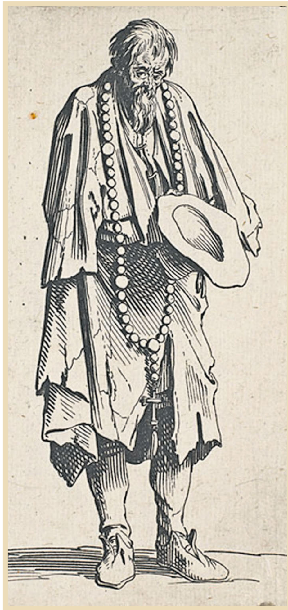
Das Wallis ist bei wachsender Armut mit häufigerem Betteln konfrontiert. Ein strenges Gesetz und eine Armenpolizei sollten der Bettlerei wehren und Armut bekämpfen.

Trotz der strengen Gesetzgebung aus dem Jahre 1827 nimmt die Bettlerei im Wallis stetig zu. Darum schlägt die Regierung im Beschluss von 1850 auch harte Töne an. Sie verpflichtet die Gemeinden zu Massnahmen gegen die Bettlerei und verlangt von ihnen, dass sie die gesetzlichen Bestimmungen strikt zur Anwendung bringen. Säumige Gemeinden haben Bussen zu gewärtigen. Die Gemeinden sollen «Armenkataster» errichten und ein Budget zu den Bettlern vorlegen, mit denen sie den «wahren Armen» helfen. Eine «Armenpolizei» wacht über die Einhaltung der Vorgaben. Die «falschen» Armen hingegen sollen die ganze Härte des Gesetzes zu spüren bekommen. Wie in heutigen Zeiten nehmen zuerst die Familie, dann die Wohn- oder Herkunftsgemeinden die Bedürftigen in Obhut und müssen für sie sorgen. Immerhin gibt es heute im Wallis keine Armenpolizei mehr, wie das 1850 der Fall ist.