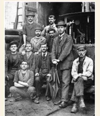
Die Industrie-Gesellschaft von Sitten ist die erste ihrer Art in der Westschweiz.