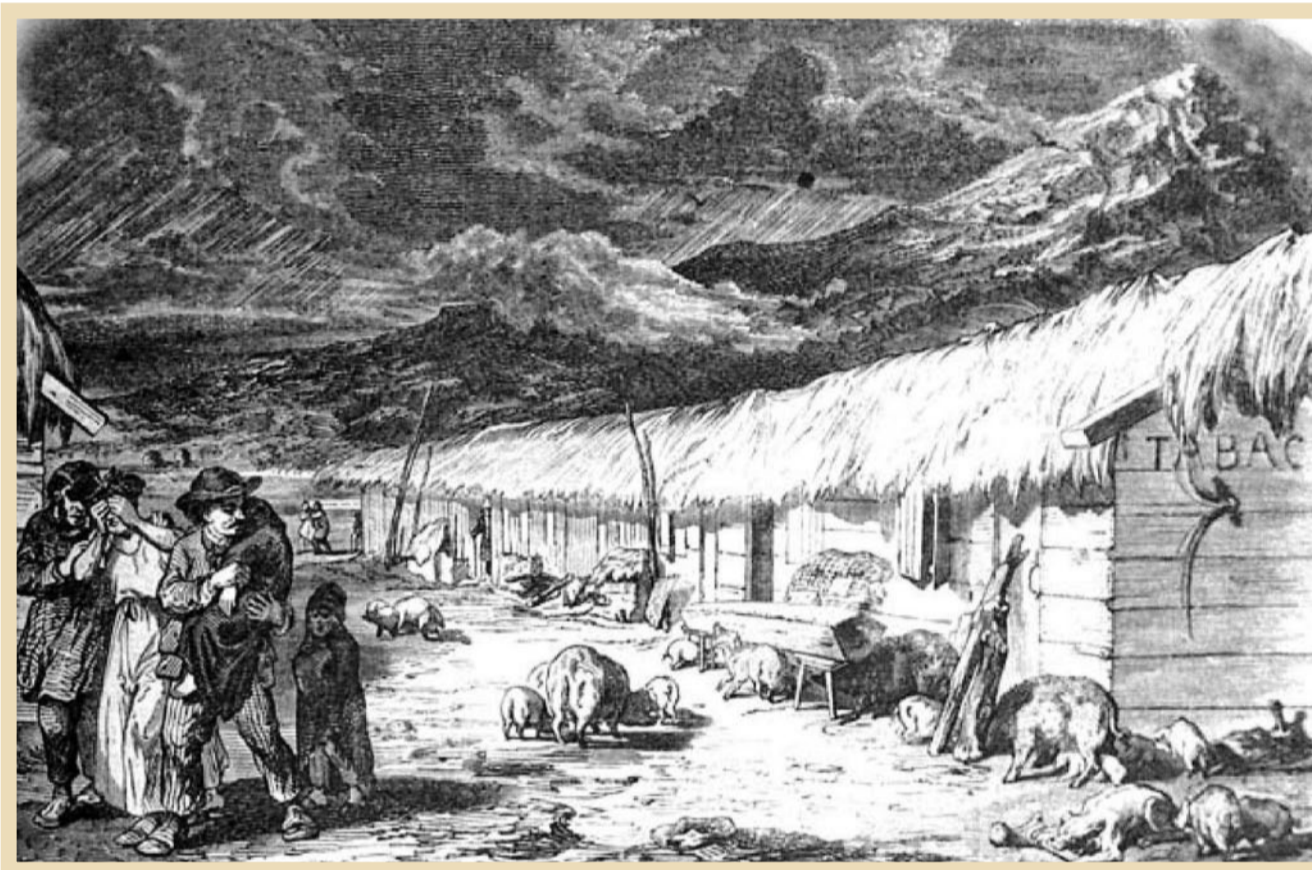
Um der Armut zu entkommen, wandern viele Walliser aus, doch oft finden sie nur Misere, Krankheit und Tod...