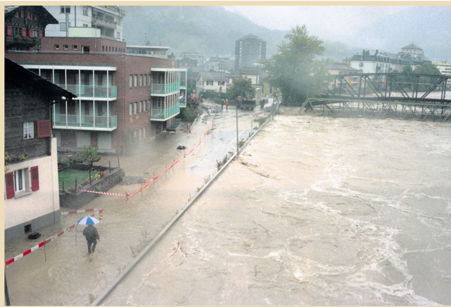
1993 – Brig unter Wasser, die Saltina verlässt ihr Bett und lagert Geröll und Schutt im Städtchen ab. Zwei Menschen sterben.