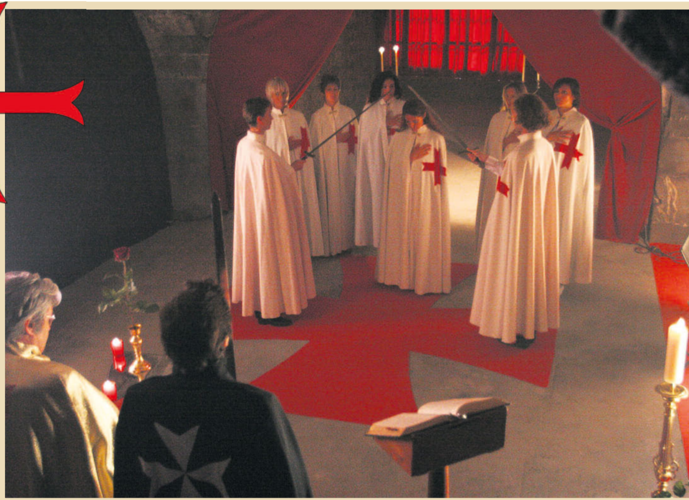
Die Dramen der Sonnentempler-Sekte mit Dutzenden von Toten zeigen die Gefahren von Sekten auf.

Auch wenn man nicht alle Antworten auf die Fragen kennt, die von diesen Dramen aufgeworfen werden, liegt ihnen doch ein einheitlicher Raster zugrunde. In Cheiry sind die Körper der in zeremonielle Gewänder gehüllten Toten von Kugeln durchsiebt. Zwei Personen sterben durch Ersticken in Plastiksäcken. An der Mordthese gibt es kaum Zweifel. In Salvan hingegen sind an den Leichen keinerlei Spuren von Gewalt auszumachen. Curare, ein Gift auf pflanzlicher