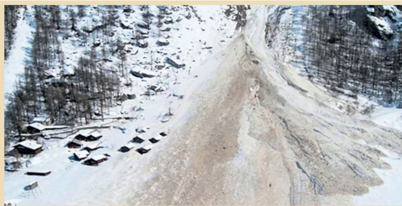
Die Lawine von Evolène fordert 12 Todesopfer und zerstört mehrere Gebäude.

Es fällt viel Schnee in diesem Winter 1999 im Wallis. Es sind an manchen Orten mehrere Meter. Ungewöhnliche klimatische Bedingungen lösen am 21. Februar mehrere Lawinen oberhalb von Evolène aus, die bis in die Weiler La Sage und Villa vorstossen. Die weisse Woge, die sich nach dem Stillstand an einigen Stellen bis zu 20 Meter auftürmt, reicht bis in den Talgrund und zerstört neun Ferienhäuser und beschädigt weitere. Die Schneemassen überqueren sogar den Fluss Borgne und zermalmen auf der gegenüberliegenden Talseite landwirtschaftliche Gebäude, die über 300 Jahre alt sind.