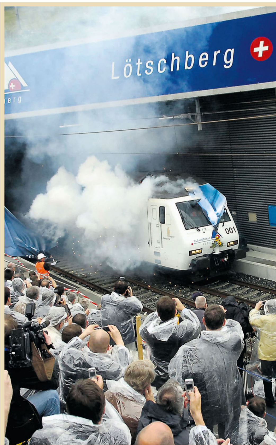
Die Ankunft des ersten offiziellen Zuges durch den Lötschberg-Basistunnel ist ein grosses Medienereignis.

Ob ein Endausbau noch in dieser Generation infrage kommt, steht in den Sternen, denn er hängt auch davon ab, ob sich die europäische Wirtschaft wieder erholt.